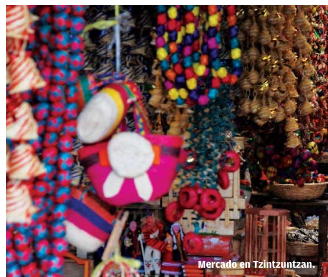
Mercado en Tzintzuntzan.

Ubicado en el centro de la meseta purépecha, la cabecera municipal de Paracho involucra a ocho poblaciones de tradiciones y modos de vida muy particulares, relacionados en gran medida, con la cadencia que dan las melodías de cuerda. Paracho es bien llamada la capital de la guitarra y sus artesanos son lauderos de gran sensibilidad en la elaboración de