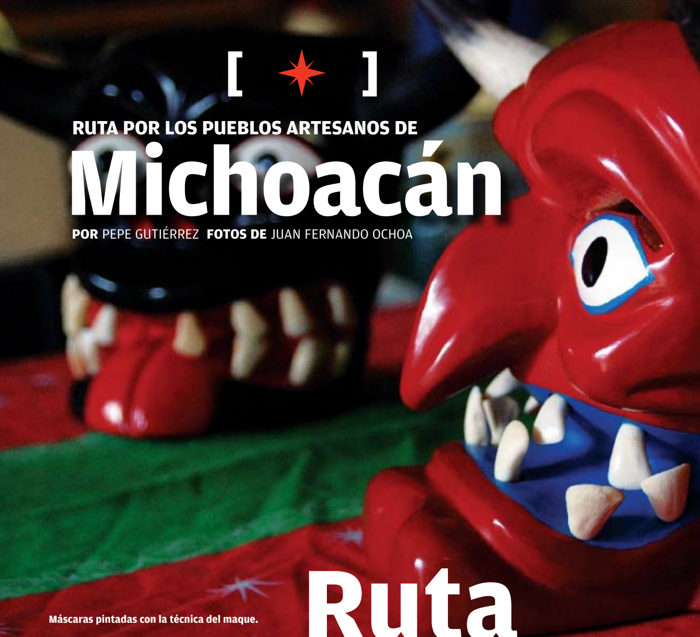
Máscaras pintadas con la técnica del maque.

POR PEPE GUTIÉRREZ